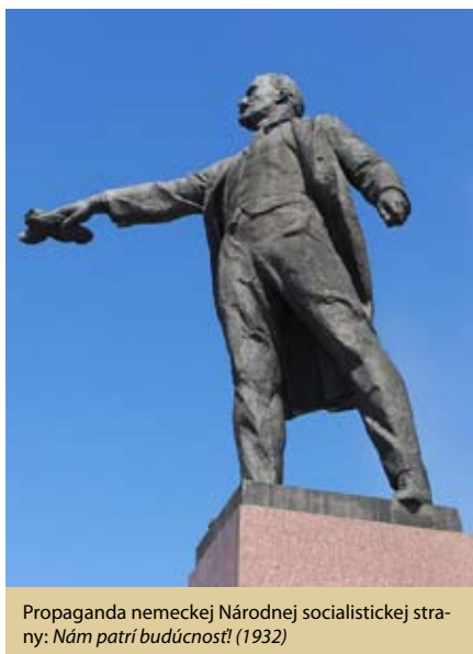
Propaganda nemeckej Národnej socialistickej strany: Nám patrí budúcnosť! (1932)

Pred nedávnymi parlamentnými voľbami na Slovensku pútala pozornosť médií kauza hnutia Obyčajní ľudia a nezávislé osobnosti v súvislosti s testovaním politických kandidá-