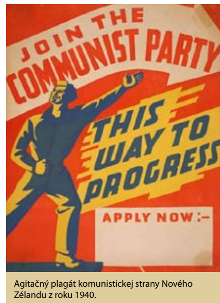
Agitačný plagát komunistickej strany Nového Zélandu z roku 1940.