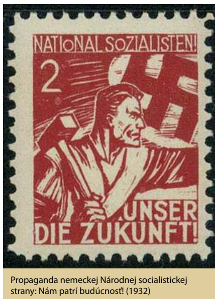
Propaganda nemeckej Národnej socialistickej strany: Nám patrí budúcnosť! (1932)