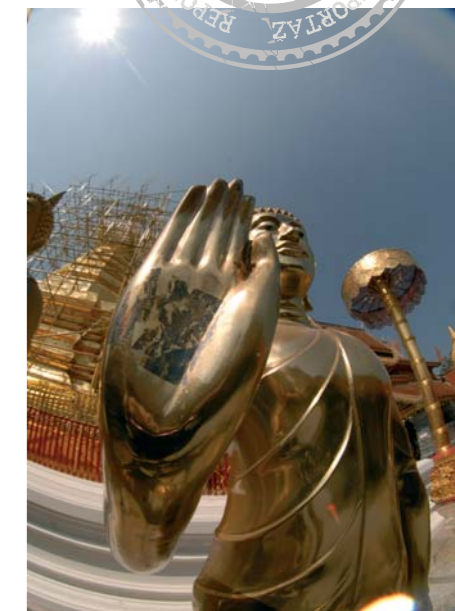
Zlatý Budha v komplexe chrámov na Chiang Mai

Stopäťdesiatistícové mestečko má sympatickú atmosféru „takmer vidieka“. Centrum obobínajú prerušované hrady z dávnych čias. Mopedy ako preprava jednoznačne vyhrávajú. Týždenný rent tátoša nás vyšiel tradične skoro nič. Na motorke sa vyškriabeme všade. Na thajské raňajky nás prehovorí partia Amíkov. Ani sa nenazdám a prežívam vyprázanú