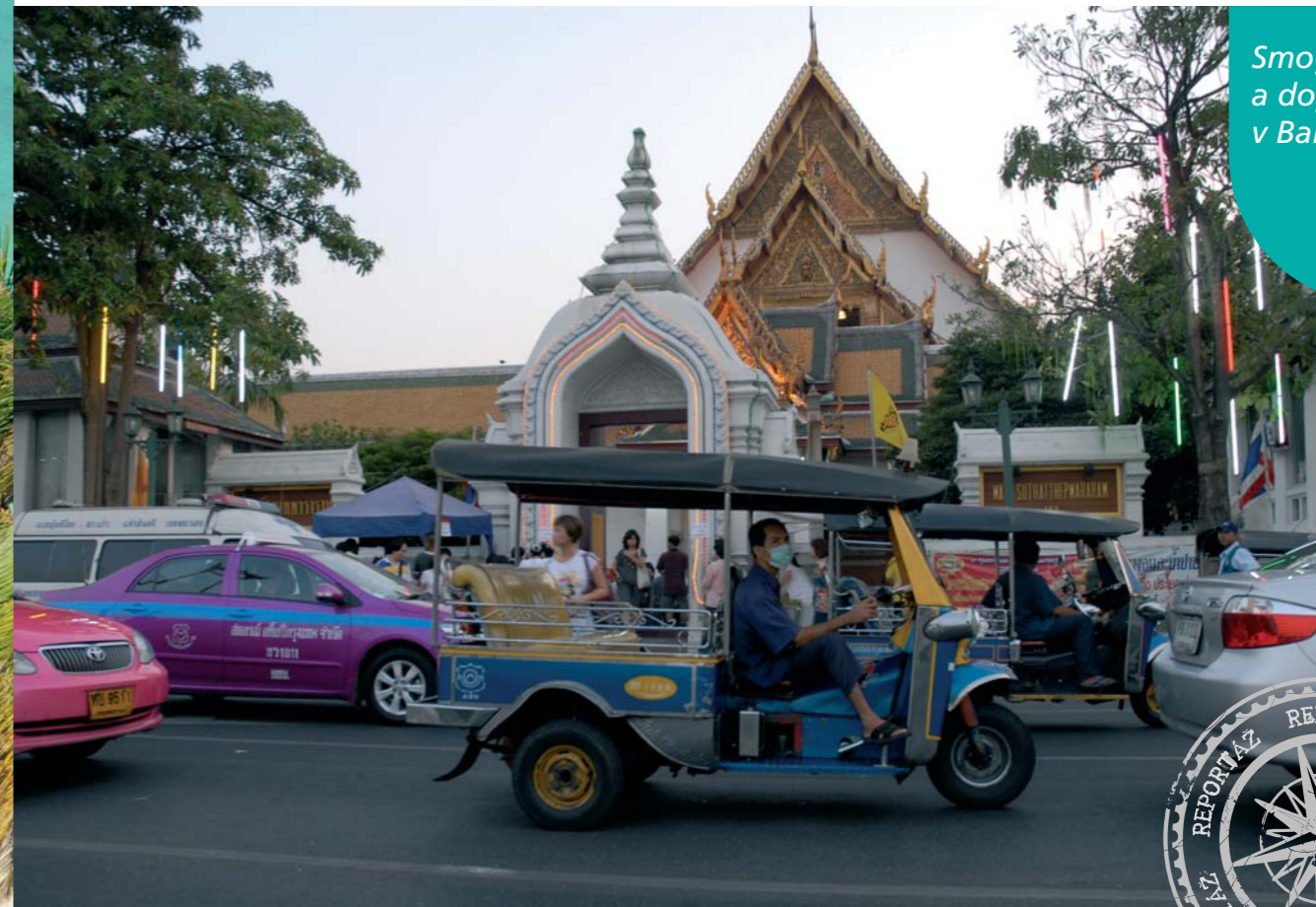
Smog a doprava v Bangkoku

Hovoriť o smogu v Bangkoku je ako podplácať policajta v Škandinávii. Je to jasné ako facka, bez diskusie sa s tým zmieriť. Po prilete? Podme rýchlo na Khao San Road. Ulicu, ktorú spozná snáď každý dobrodruh pri