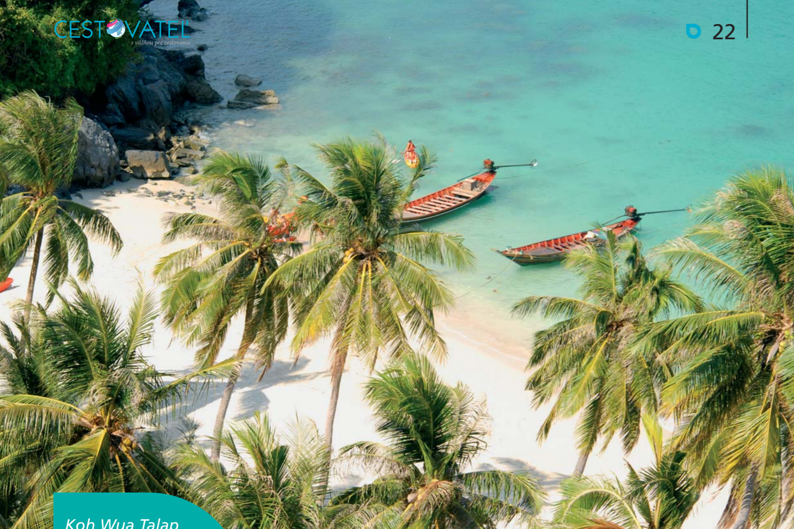
Koh Wua Talap pláž

Zaletieť si na ostrov ako vystrihnutý z filmu Pláž s Di Capriom a vypekať sa do odletu sme však do Thajska určite neprišli. Spoločné sme možno chceli mať iba pekelné dobrodružstvo, aké zažila Leonardova postava. Hm, ale... kdeže Caprio! Za mesačný úlet do juhovýchodnej Ázie by nás potľapkal po pleci sám Indiana Jones. Narýchlo si viem spomenúť na prežitie besného útoku divého slona a popritom aj prestrelku v potravinách za bieleho dňa. Na Thajsko sme sa nervózne tešili a dostali sme oveľa viac, ako sme si kedy stihli v živote vyfantazirovať. Hľadali sme totiž luxus v ľuďoch nie v hoteloch. V ľuďoch so zamatovou dušou.