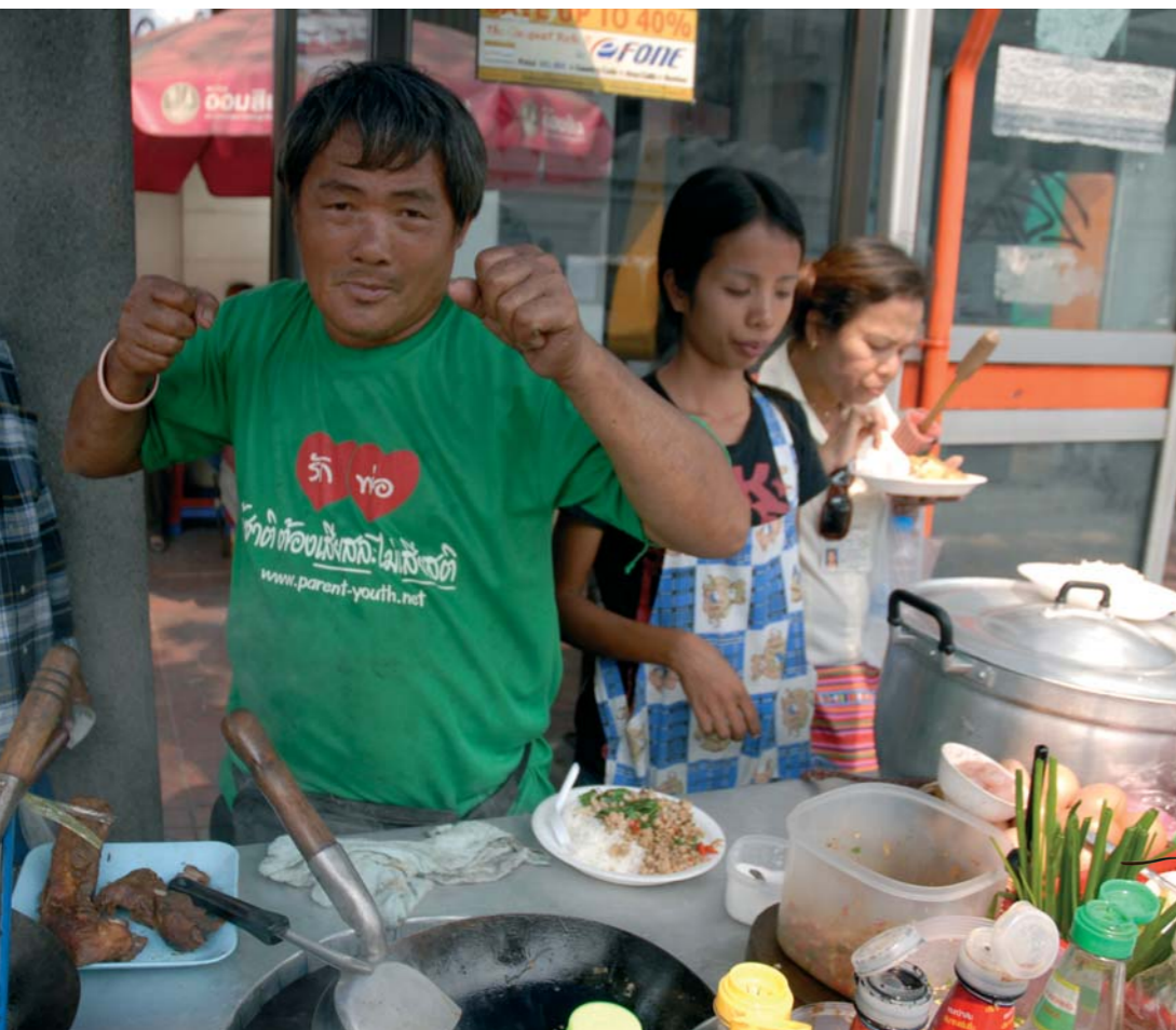
Náš kuchár v uliciach Bangkoku