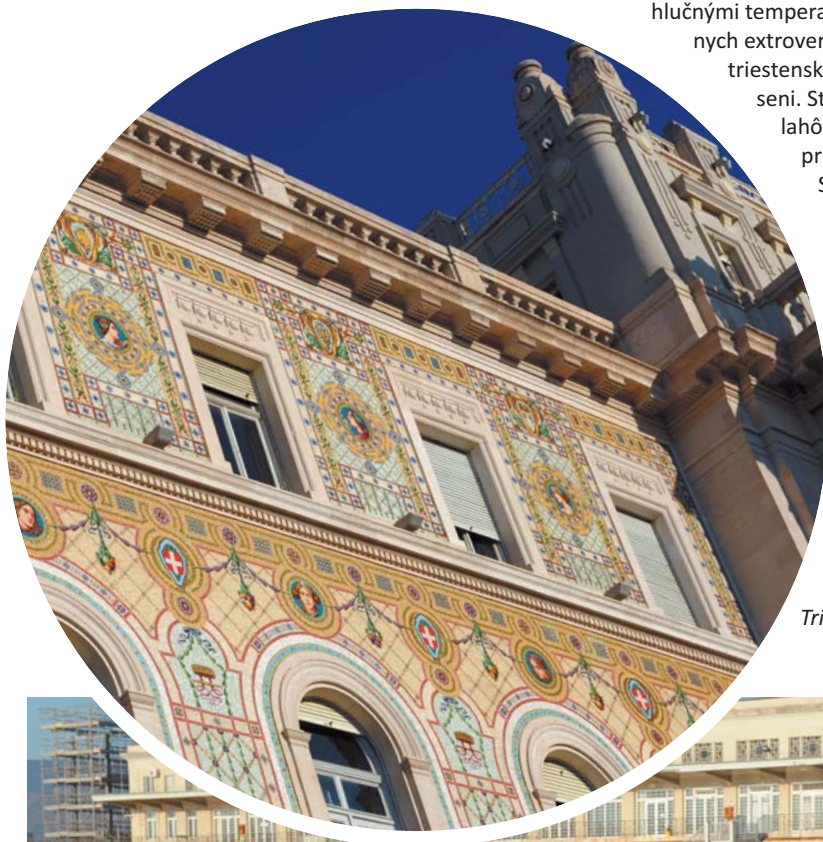
Trieste, Taliansko a jeho neskutočne nádherná architektúra

Cez Kozinu klesáme širokými cestami k moru. Serpentinami schádzame na sever Apeninského polostrova, vrch tejto čižmy očaruje. Sever Talianska je hneď slnečný. Hmlu vystriedalo modré nebo. Vivat Italia! Smerujeme do slávneho Trieste. Najprv na nás pôsobí ako obyčajné veľké rybárske mesto. Mýlime sa. Trieste je historicky skvost so všetkým. Prechádzka centrom s hlučnými temperamentnými Talianmi nás utvrdí, že sme na návšteve u totálnych extrovertov. Prvý nápoj je talianske espresso, potom už neodoláme triestenskému pivu. Na tom talianskom slnku pekne zasyčí aj v jeseni. Stačia krátke rukávy. Mólo v Trieste je ďalšia cestovateľská lahôdka. Odporúčame. Prespíme však ďalej od centra mesta v príjemnom penzióne, kde už nevedia po anglicky ani „ň“. Sme len pár kilometrov od slovínskych hraníc, no beznádejne. Zvykáme si na „taliangličtinu“ u mladých. U starších musia vystačiť ruky a nohy. Navštívime hrad na útese. Všetko je taliansky voňavé, no kde zmizli tie krásne ženy? Fakt! Už nie sme v Slovinsku. Po ďalšom rannom espresso, ktoré zrýchli tep trojnásobne, pokračujeme do slávnej Verony.