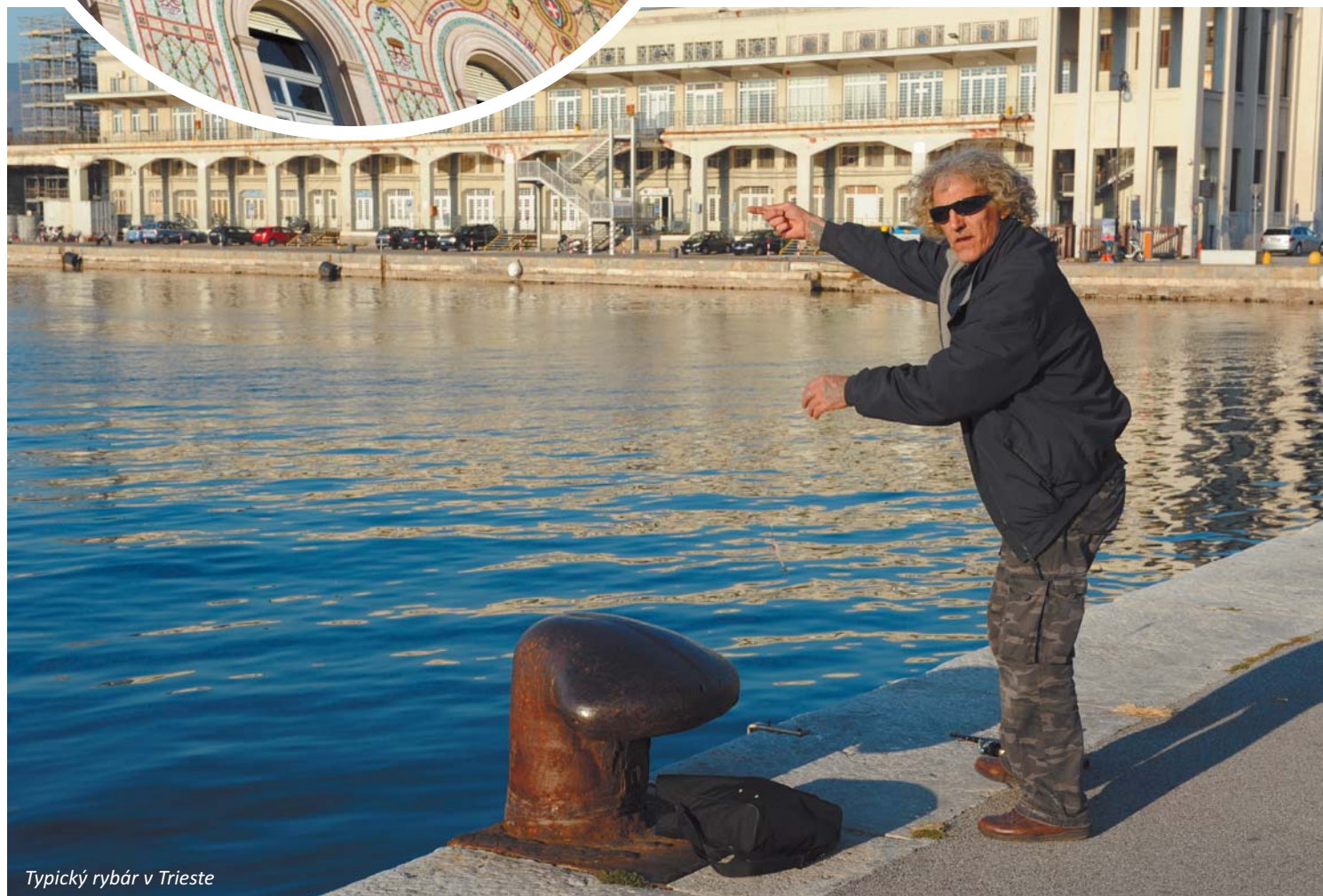
Typický rybár v Trieste