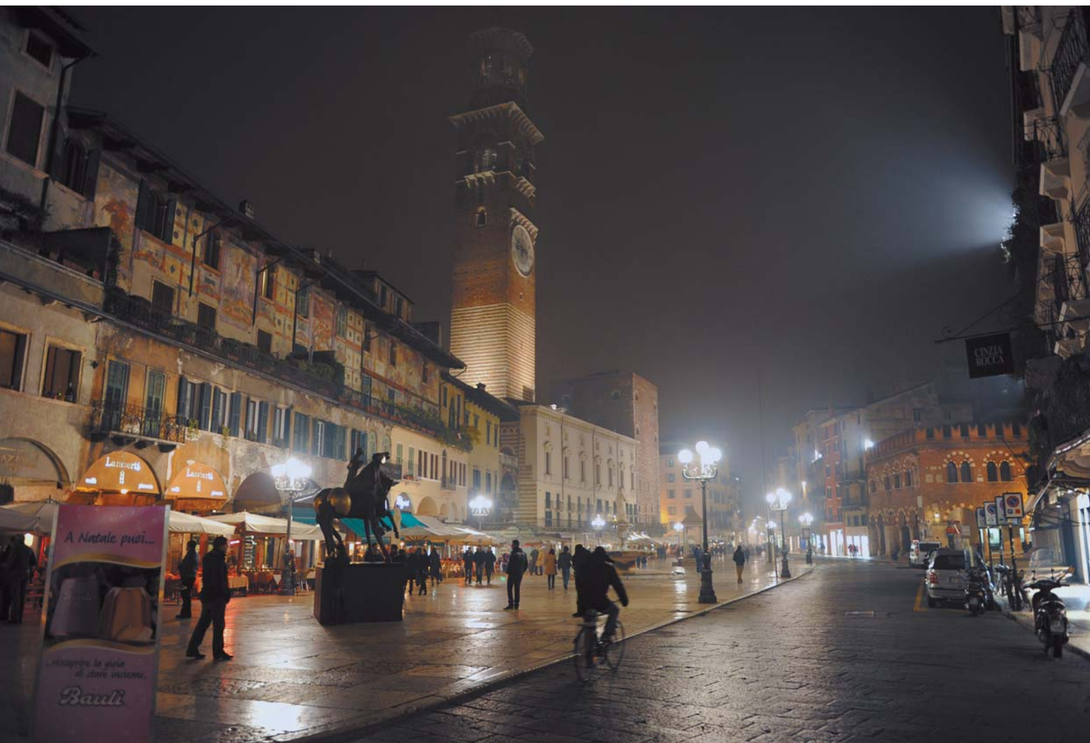
Piazza delle Erbe, Verona, kde má penthouse aj slávna Madonna