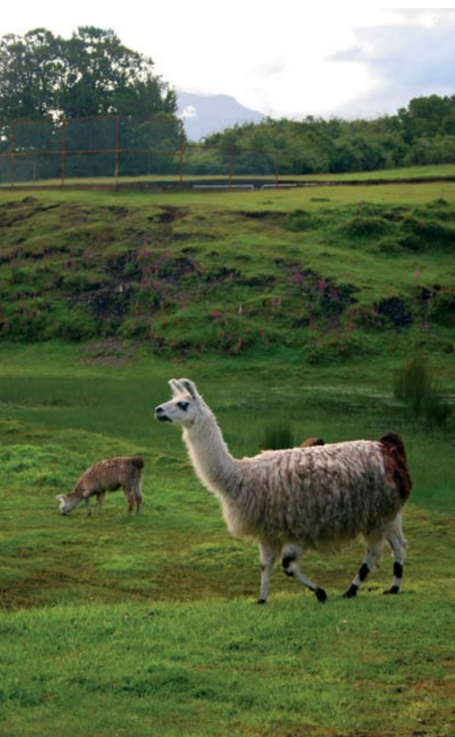
Lamy v Čile

západného ostrova. Dostali sme sa k nim na niekoľko metrov. Zdá sa, že sú zvyknuté na zvedavých turistov. Kocháme sa pri pohľade na ich rutinnú hru. Predvádzajú sa, pripomínajú nám delfíny či vráskavce, ktoré ako na povel vyskakujú z vody pred hĺkajúcim davom natrieskanej výletnej lode. Toto je však iný level nadšenia. My len tíško vzdychneme. Počuť len ich čudný kvakot a cvakanie spúšťa našich zrkadloviek. Naozaj sa oplatí prísť v malých skupinách. Počkáme na západ slnka, kedy sa vyberú na lov... Opúšťame kúzelné miesto pozorovania. Hľadáme miesto na postavenie stanov. Nie všade sa to zdá legálne. Lámeme pravidlá, no neškodíme prírode. Nie sme provokatéri, oheň nezakladáme. Sme na suchej strave. Unavení zalomíme ako kuželky. Zavčas ráno nás budia albatrosy. To je neuveriteľné! Tučniaky a teraz toto? Žijeme svoj sen. Prejdeme pobrežie, kde sa zdá, že uvidíme aj nejaké veľryby. Vráskavec nesklamal. Nezostal nič dlhý svojej povesti excentrického cicavca. Prehliadku veľrýb pri návrate do Antark-