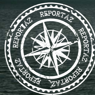
Čile, scénické plavby

vlnou v kanáli Beagle. Súostrovie nám každým uzlom ukazuje krajšie prostredia.